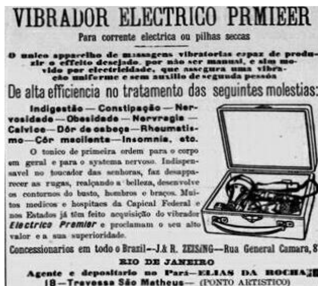
Figura 5: Vibrador Eletrico Prmieer, Jornal Estado do Pará, domingo, 11 de junho de 1911.

indispensável “no toucador das senhoras”, já que fazia “desaparecer as rugas, realçando a beleza”, desenvolvendo “os contornos do busto, hombros e braços.”