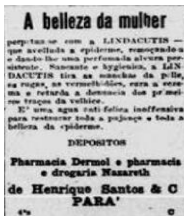
Figura 4: A beleza da mulher, Jornal Estado do Pará, quarta - feira, 7 de fevereiro de 1917,

A historiadora Denise B. Santana (1995) analisando remédios que foram anunciados em jornais e revistas no período de 1900 a 1930, afirma que estes remédios cujo objetivo era curar “defeitos” da aparência feminina, como “manchas da pele, rugas, vermelhidão, traços da velhice”, como é prometido pelo Lindactis na figura abaixo, pareciam mais produtos de beleza, mas raramente foram chamados de cosmético.