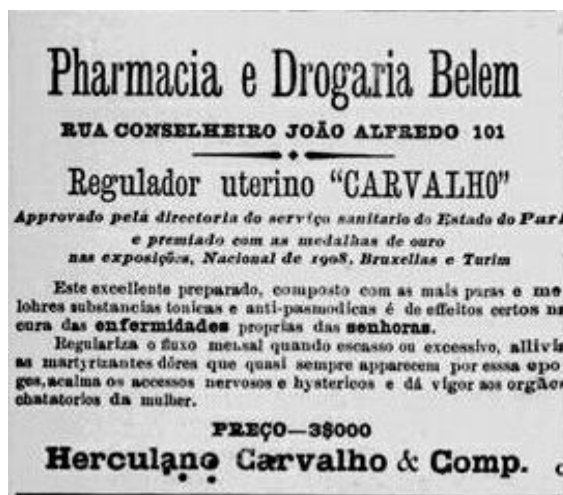
Figura 1: Regulador uterino “Carvalho”, Jornal Estado do Pará, domingo, 26 de novembro de 1911.

Em 1911, em Belém do Pará, não era incomum os leitores do jornal Estado do Pará se depararem com o anúncio acima do Regulador Uterino Carvalho , que era vendido na Farmácia e Drogaria Belém. Assim, dentre outras funções o referido remédio serviria para acalmar os “acessos nervosos e histéricos” tratados pelo anunciante como “enfermidades próprias das senhoras”. Essas enfermidades seriam causadas pelas irregularidades do ciclo menstrual, por isso era necessário regularizá-lo, daí o nome desses medicamentos. A