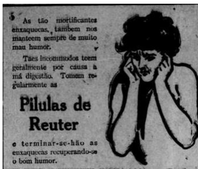
Figura 2: Pílulas de Reuters, Jornal Estado do Pará, quinta – feira, 2 de janeiro de 1919