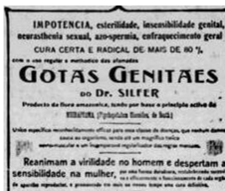
Figura 8: Gotas Genitae. Jornal Estado do Pará, quarta – feira, 4 de novembro de 1914

Cuidar do corpo feminino, era cuidar da aparência, do útero, da pele, da juventude, da beleza, do bom humor. Portanto, a maioria dos anúncios pesquisados tinham como alvo um público feminino. Um dos poucos anúncios em que se percebe problemas que poderiam afetar os homens como a “impotência” é o do remédio Gotas Genitais do Dr. Silfer, que prometia “mais de 80% de cura certa e radical” dos enfraquecimentos de homens e mulheres. Assim,