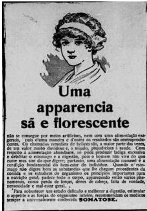
Figura 6: Uma aparência sã e florescente, Somatose, jornal Estado do Pará, quarta feira, 4 de novembro de 1914

É o caso por exemplo do Somatose , um medicamento indicado tanto para homens quanto para mulheres, pois prometiam combater a má digestão e estimular o apetite. Em sua propaganda acima, os chamados “remédio de belezas” são taxado de meio artificiais podendo ser prejudiciais à saúde. E que para se ter de fato uma aparência “sã e florescente” o medicamento Somatose era o recomendado. Uma das estratégias para chamar atenção do público feminino era colocar a imagem de uma mulher jovem, branca com uma expressão calma e agradável seguida do destaque das palavra-chave: aparência. De acordo com Cunha e Nascimento (2008):