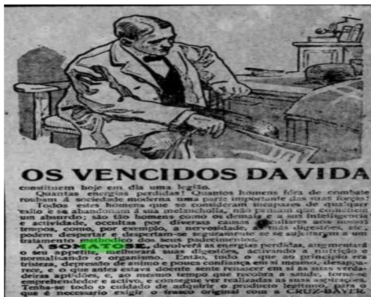
Figura 7: Os vencidos da vida, Somatose, jornal Estado do Pará, domingo, 1 de onde 1914.

voltar a ser saudável, o homem se tornaria, ativo e alcançaria suas aspirações. Juntamente por isso, um mesmo produto poderia ter mais de uma propaganda, uma para os homens com representações acerca da força e da virilidade e outra para as mulheres com representações de mulheres belas e jovens.